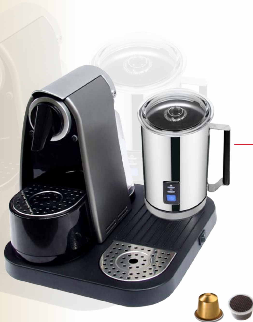
Macchina per caffè espresso in capsula con montalatte elettrico